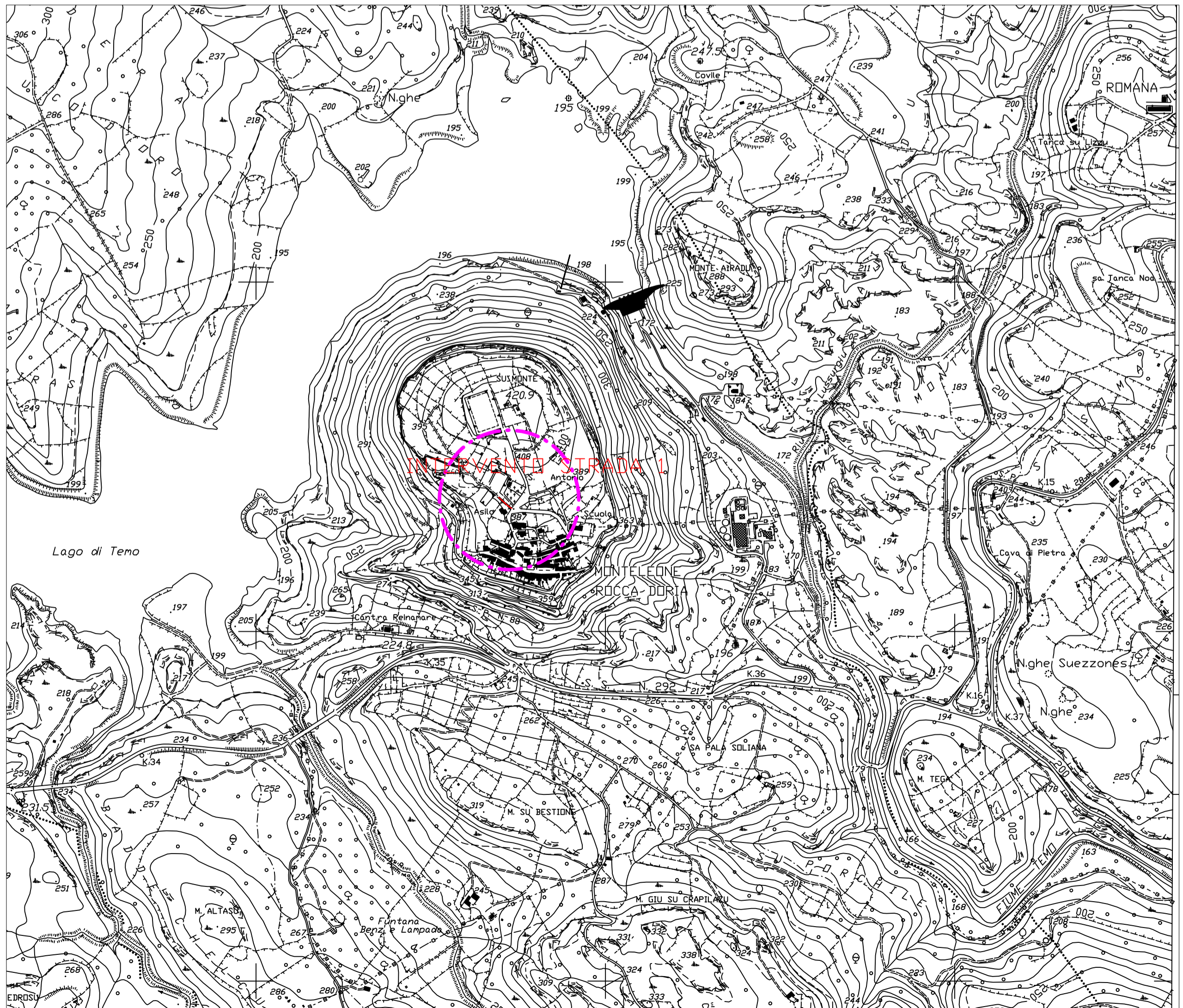
Inquadramento territoriale interventi su CTR 1:10.000