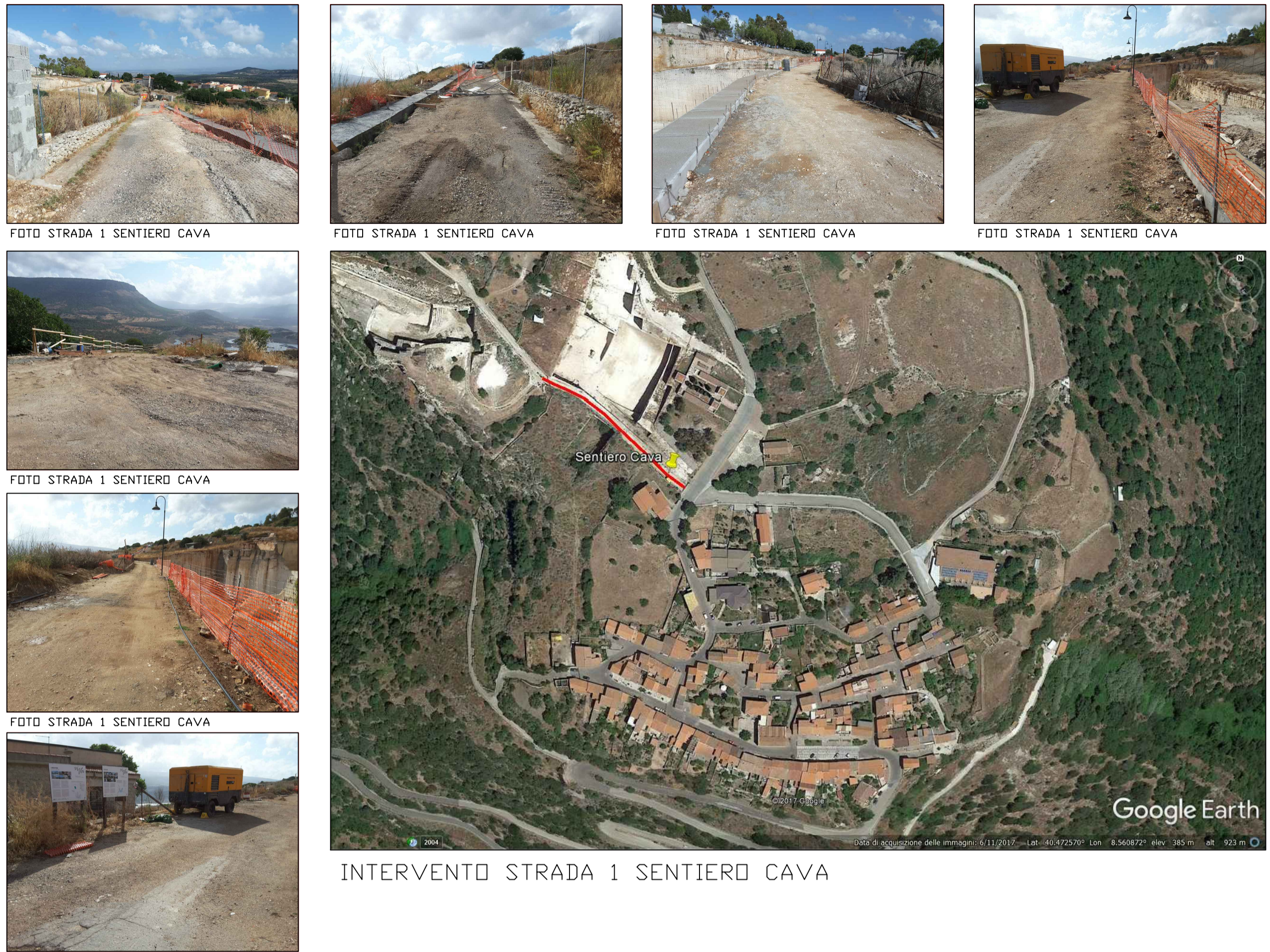
INTERVENTO STRADA 1 SENTIERO CAVA